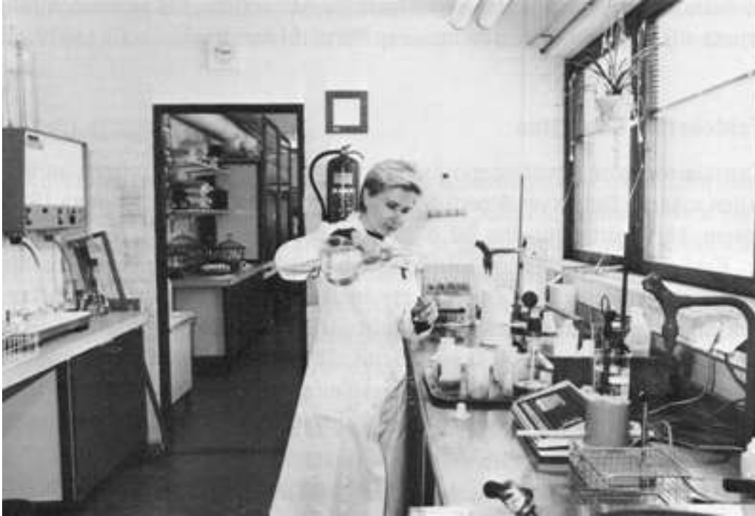
Metsäntutkimusaseman laboratorio, joka sai lisätilaa laajennuksesta.

Metsäntutkimuslaitoksen Parkanon tutkimusaseman alkuna pidetään Karvian varavankilan lakkauttamista vuonna 1960. Varavankilalle kuuluneista alueista noin 2.400 hehtaaria luovutettiin metsäntutkimuslaitokselle tutkimustoimintaan. Laitoksella oli ennestään vuonna 1925 muodostetun Pohjankankaan kokeilualueen rippeitä. Kun alueeseen liitettiin lisäksi entiseen Karvian hoitoalueeseen kuuluneita valtion maita, nousi kokeilualueen koko pinta-ala 4.023 hehtaariin. Tästä 1970 hehtaaria on Parkanon alueella.