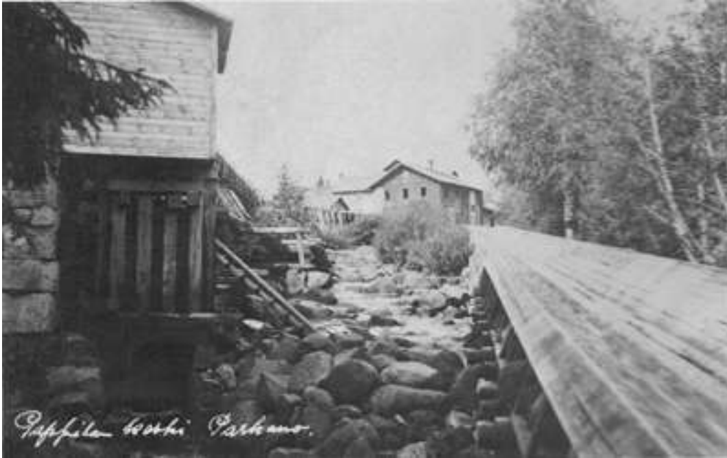
Pappilankoski joskus ennen.

Linnanjärvi purkaa vetensä kapeista salmista ja pikku jänistä muodostuneen Kaitojen vetten läpi Viinikanjokeen ja edelleen